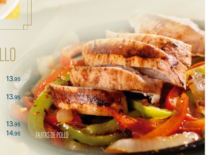
FAJITAS DE POLLO